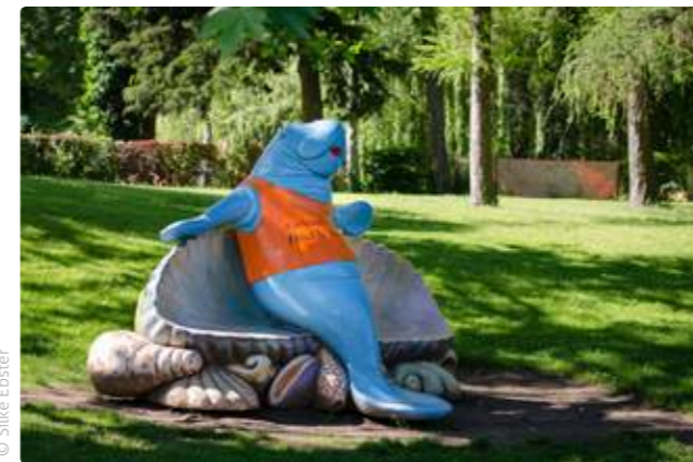
Schlosspark | Linda-Sitzbank

... ein Foto von Ihnen und Ihrem Lieblingsplatz in Bad Vöslau. Schreiben Sie uns, was Ihnen daran ganz besonders gefällt. Wir freuen uns auch über Ihre kleine persönliche Urlaubsgeschichte: touristinfo@badvoeslau.at