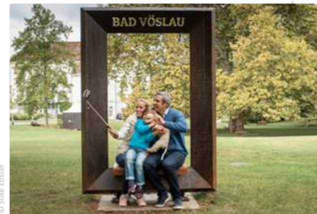
Schlosspark | Selfie-Point