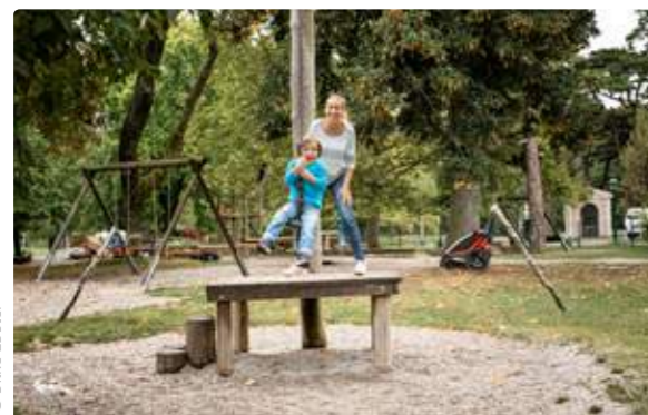
Schlossplatz | Abenteuerspielplatz