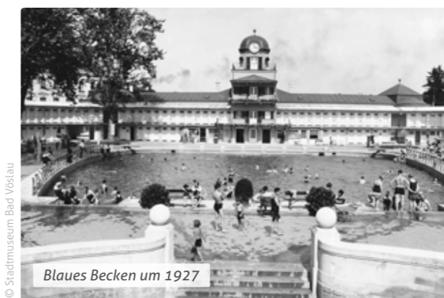
Blaues Becken um 1927