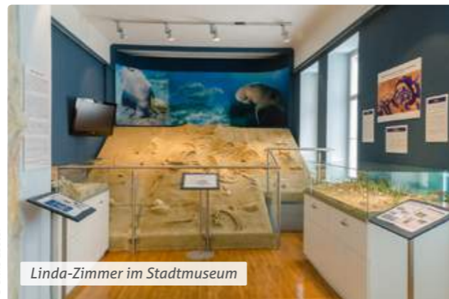
Linda-Zimmer im Stadtmuseum

Unser Museum begeistert! Mit Bildern, Modellen und Fundstücken wird Geschichte so richtig greifbar. Jedes der zehn Zimmer widmet sich einem Thema: Im Pecherzimmer wird der weithingehend ausgestorbene Beruf des Pechers thematisiert. Im Linda-Zimmer wartet das Skelett einer prähistorischen Seekuh. In der Alten Schulklasse taucht man in den Schulalltag anno 1898 ein. Auch zur Ruine Merkenstein und ihren Rittern erfährt man so einiges. Spannend!