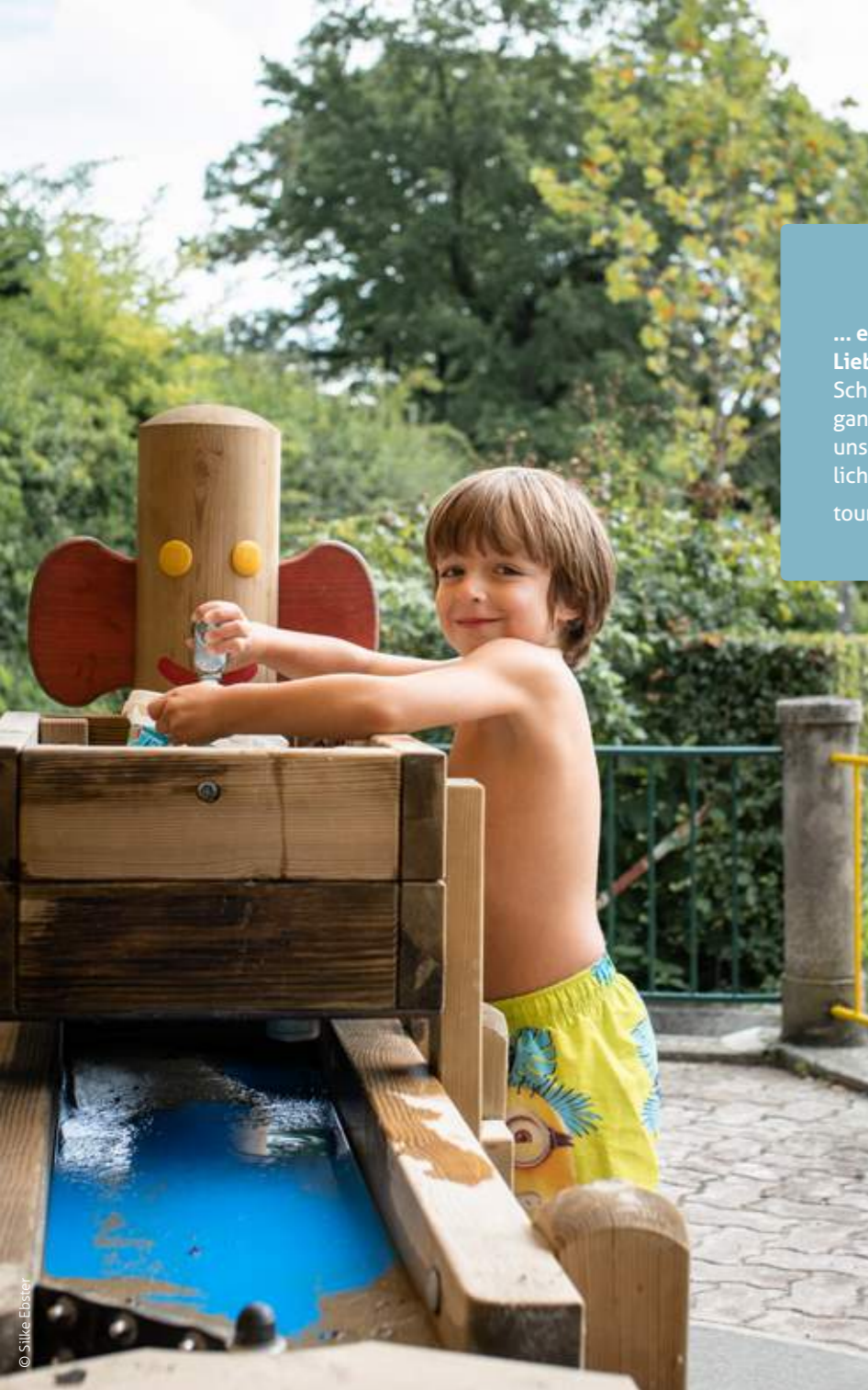
Thermalbad | Wasserspielplatz